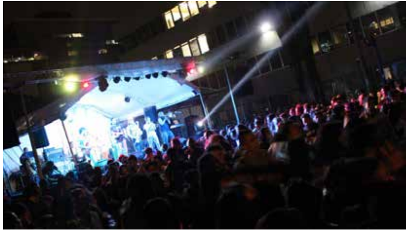
Imagen 38. Concierto durante la Semana Universitaria de las Culturas