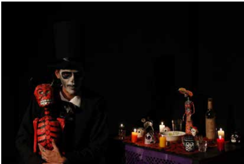
Imagen 37. El teatro hace parte del escenario de la comunidad universitaria