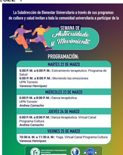
Talleres de cultura ofertados 2022-1